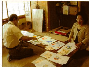
審査風景（当センター面接室）

センター創立10年の記念として、シンボルマークを募集したところ全国各地から50点の応募がありました。当センターの理事等による厳正な審査の結果、以下の方に決定致しました。これから作成するチラシやポスター、封筒などに使わせて頂きます。沢山の力作をお寄せ頂き本当に有難うございました。